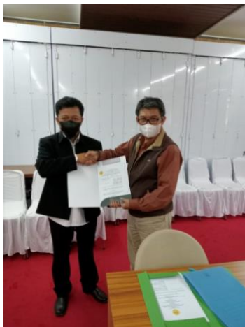
Gambar 1. Penandatanganan Dokumen Pertukaran Pelajar