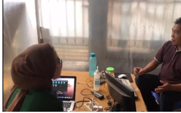
Gambar 4. Kegiatan Pembelajaran Program Studi Independen