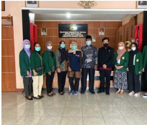
Gambar 5. Pelepasan Mahasiswa Program KKNT KSKI MBKM