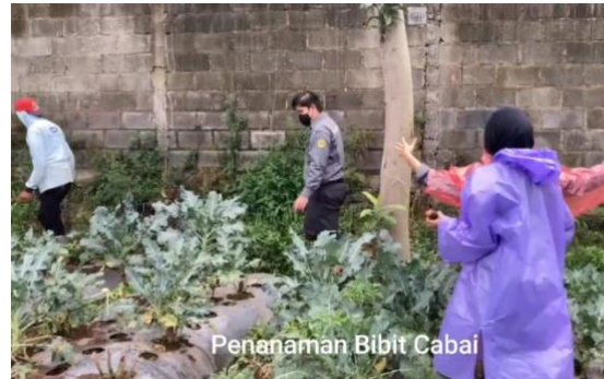
Gambar 6. Kegiatan Mahasiswa KKNT