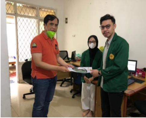
Gambar 3. Penandatanganan Dokumen Studi Independen