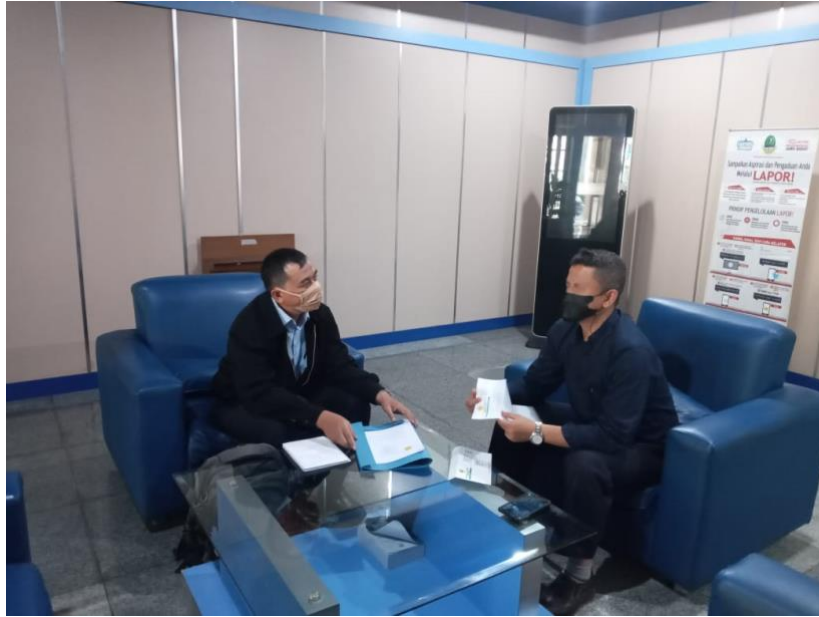
Gambar 7. Penandatanganan Kerjasama Dengan Dinas Lingkungan Hidup